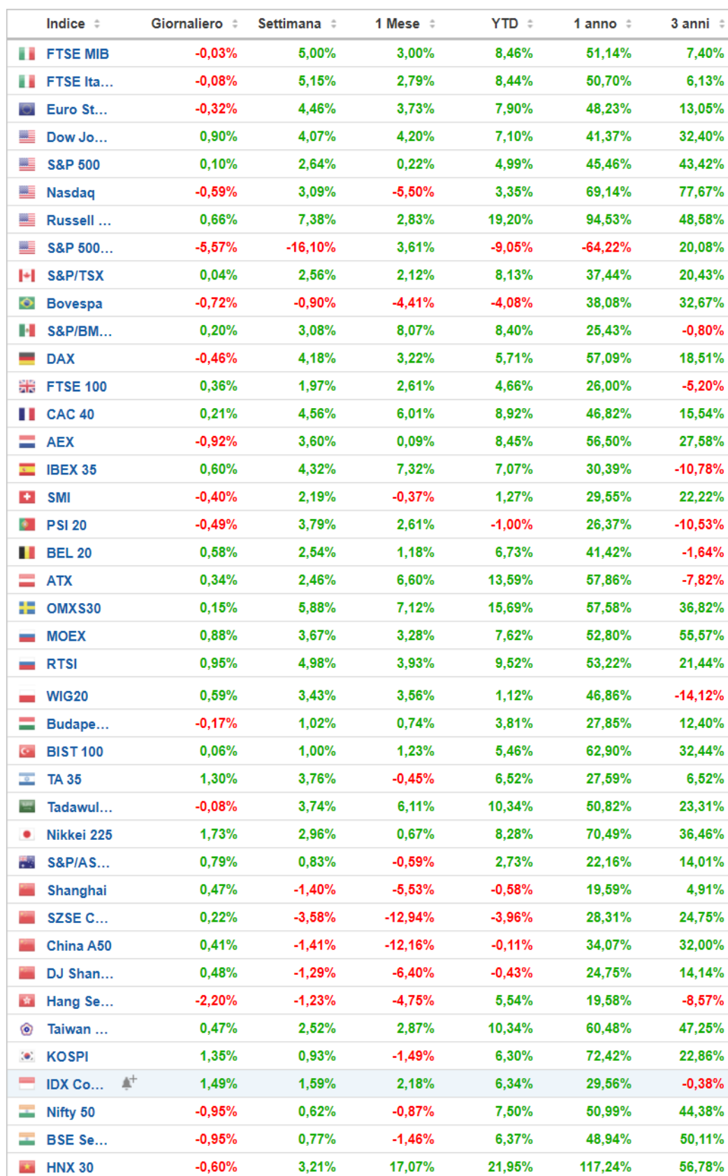
immagine e dati del 13.03.2021 dalla pagina: https://it.investing.com/indices/major-indices