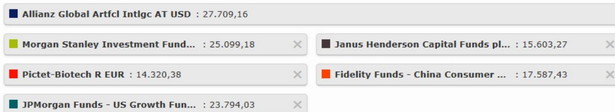
Grafico crescita (EUR) 26-01-2021

Chi ha investito quattro anni nella peggiore di queste soluzioni oggi ha il 43% in più, il più fortunato ha triplicato il capitale da 10.000 a 27.700 €, ha guadagnato il 170%.